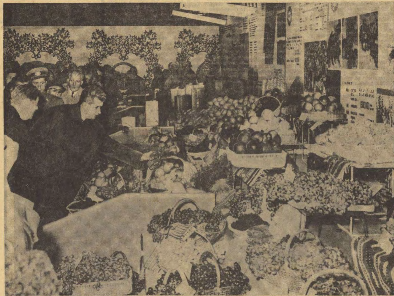
La unul din standurile expoziției de produse agricole

Tîrîni cooperatori din comuna noastră, ca și cei din întreaga țară — a spus vorbitorul — sînt bine că viața lor nouă, tot mai îmbelsugată,