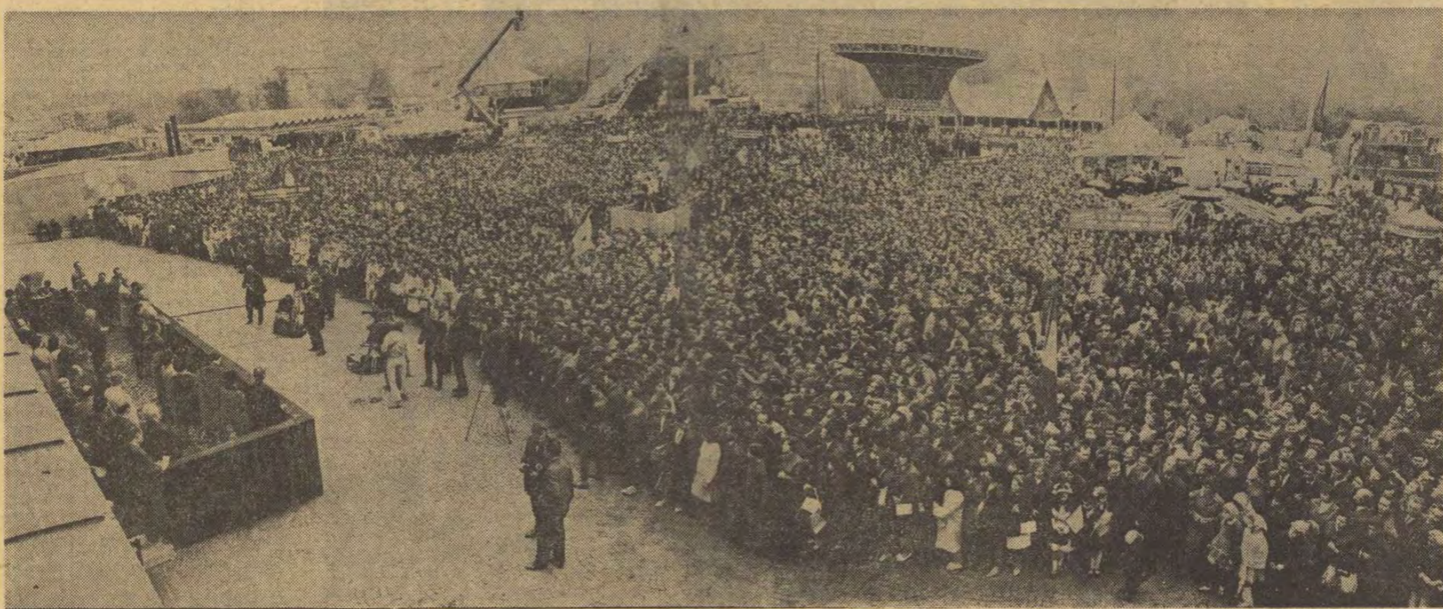
În timpul marii adunări populare din Piața Obor